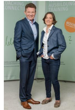
FENDEL & PARTNER UNTERNEHMENSBERATUNG

Wir freuen uns, wenn Sie uns ansprechen, weiterempfehlen und auf unsere Website www.kunst-des-zusammenarbeitens.de verweisen. Wir sind gern für Sie da, wenn Sie uns brauchen.