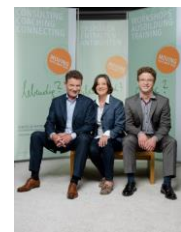
FENDEL & PARTNER UNTERNEHMENSBERATUNG

Gern können Sie uns jederzeit ansprechen, uns weiterempfehlen und auch auf unsere Website www.kunst-des-zusammenarbeitens.de verweisen.